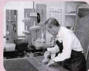
▲襖・障子・網戸の張替